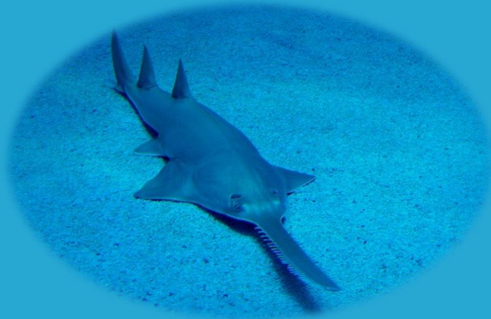
Пилконіс (акула – пилка)