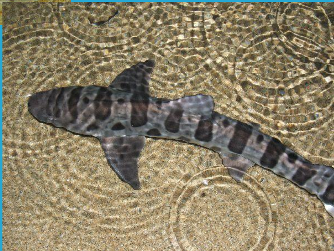
Акула - кіт